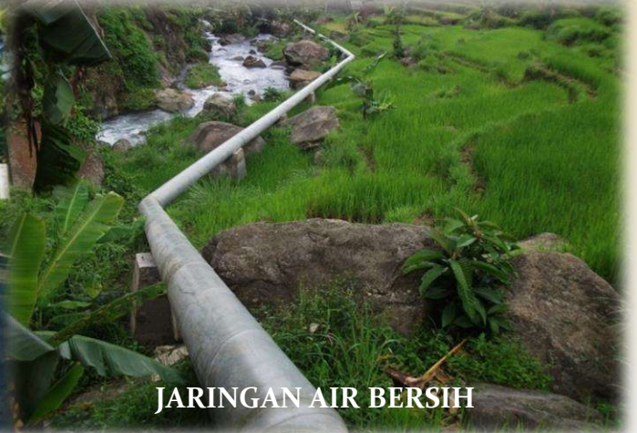
JARINGAN AIR BERSIH