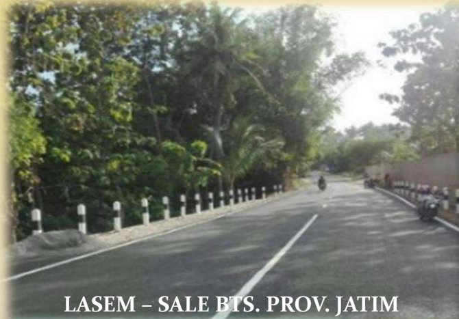
LASEM – SALE BTS. PROV. JATIM