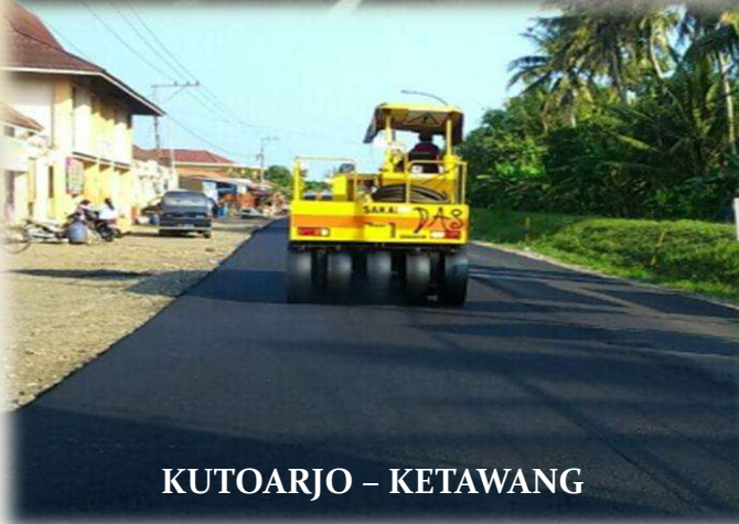
KUTOARJO – KETAWANG